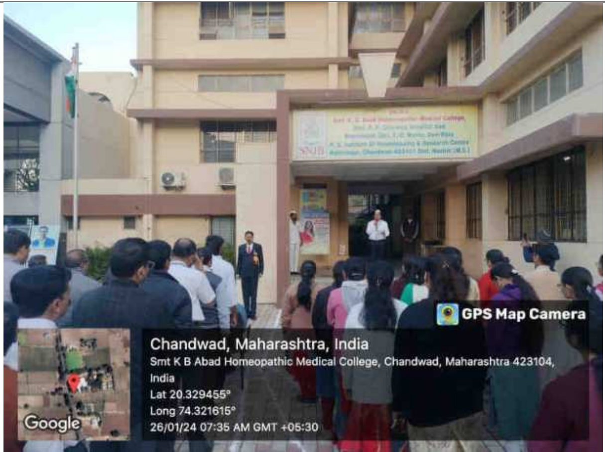
Patriotic Song Presented by Students