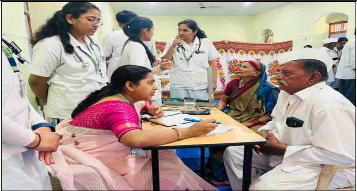
Gynac camp patient examination