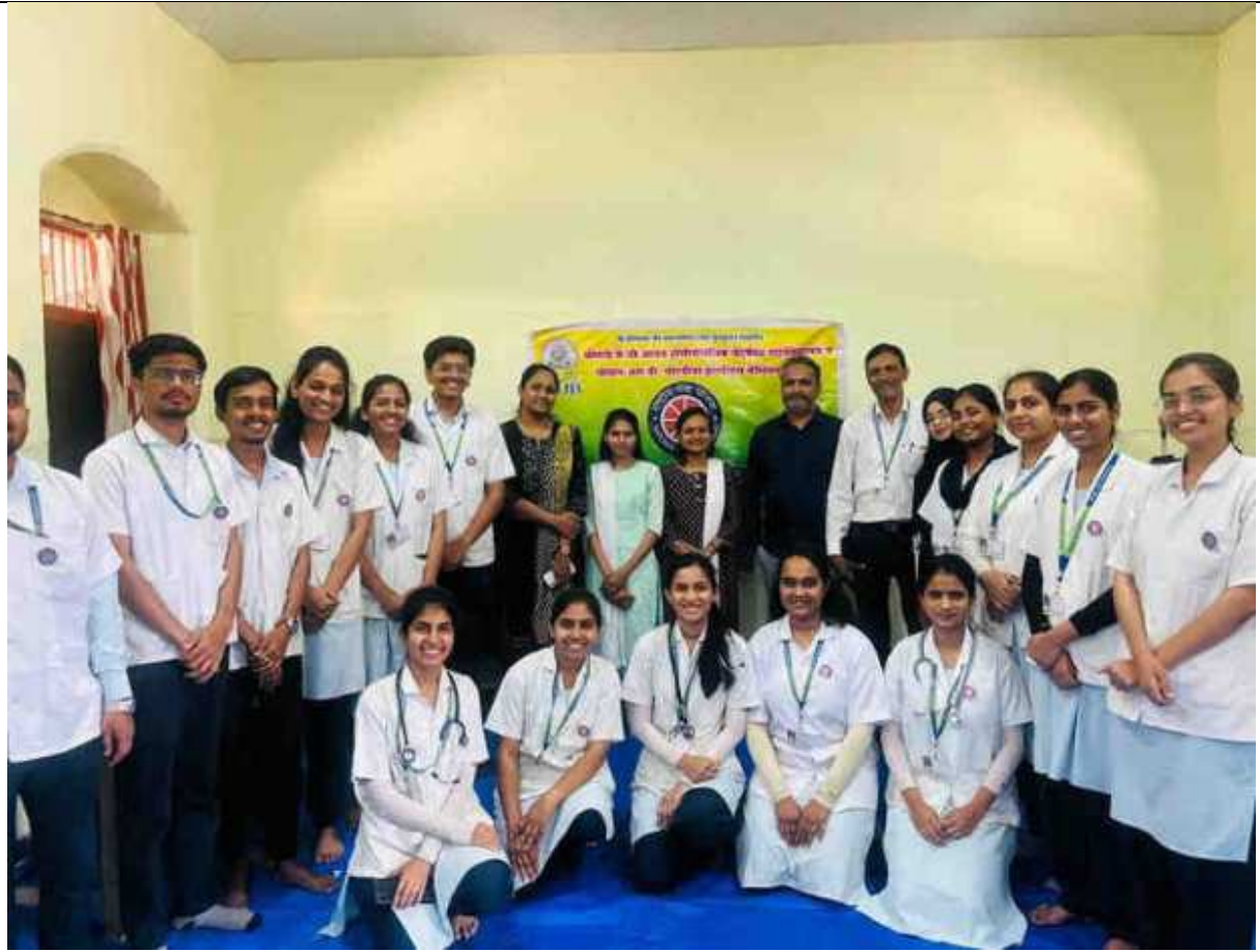
Veladictory function of NSS today at Dugaon.